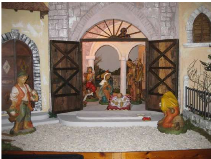
Un presepio degli anni passati

Purtroppo quest'anno la nostra chiesa corre il rischio di non avere un presepio in occasione del Santo Natale. Infatti coloro che gli anni scorsi si premuravano di allestire la Natività del Signore con maestria encomiabile, per molti e svariati motivi, non hanno rinnovato la disponibilità. Lanciamo allora un appello nella speranza che il buon cuore di molti sia toccato; chi si sente in grado di impegnarsi con serietà e capacità per questo semplice ma bellissimo servizio contatti don Lio. Grazie!