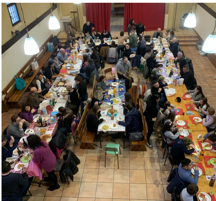
Pranzo dei bambini della prima confessione insieme alle loro famiglie, dopo la presentazione alla comunità